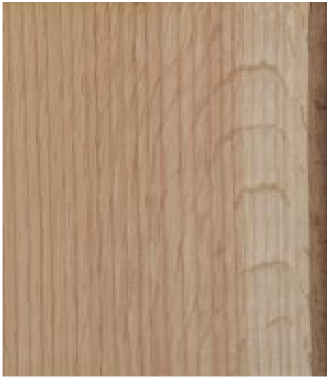
Roteiche – Radiale Oberfläche (natürliche Größe) mit deutlichen Spiegeln der großen Holzstrahlen